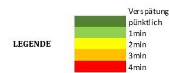
Tab. P2: Auszug Fahrzeiten - Verspätungen