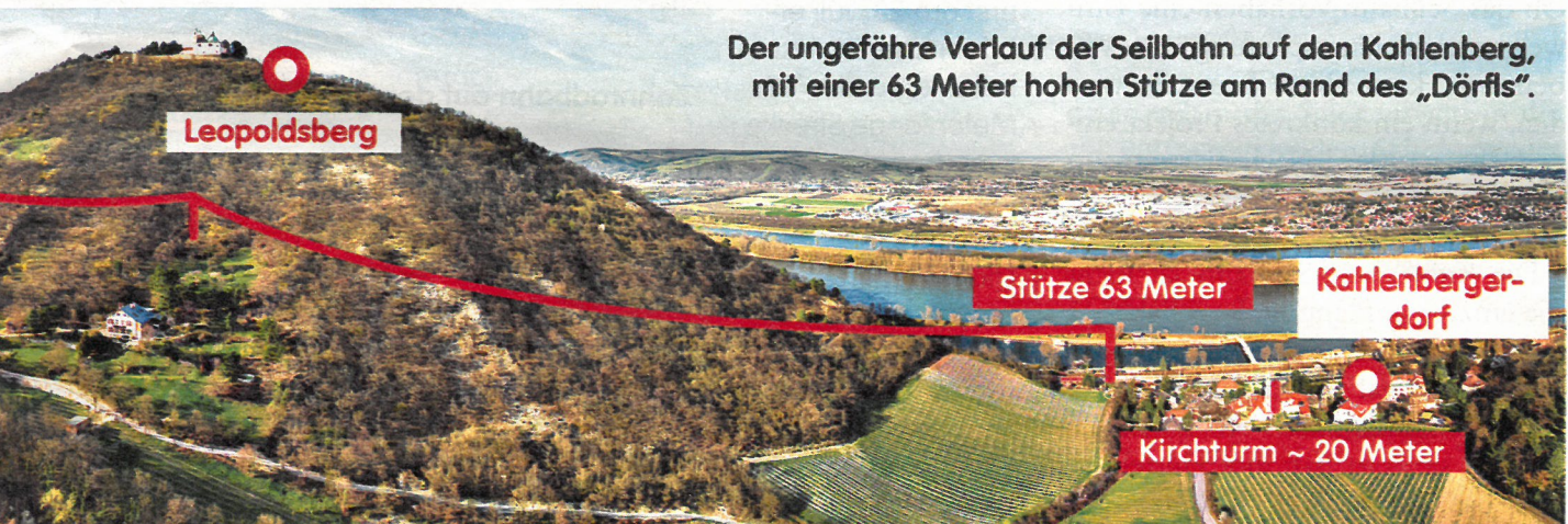
Der ungefähre Verlauf der Seilbahn auf den Kahlenberg, mit einer 63 Meter hohen Stütze am Rand des „Dörfles“.

mehr Müll, Lärm und Massen, die durch die Weingärten pilgern.“ Die gehören ohnehin größtenteils dem Stift Klosterneuburg, das dem Seilbahnprojekt laut Binder schon seinen Sanktus gegeben hat. „Hier stimmt die katholische Kirche im Zweifel für die ‚Kohle‘ und gegen die Spiritualität. Das finde ich unfassbar“, ärgert sich der ehemalige HTL-Lehrer.