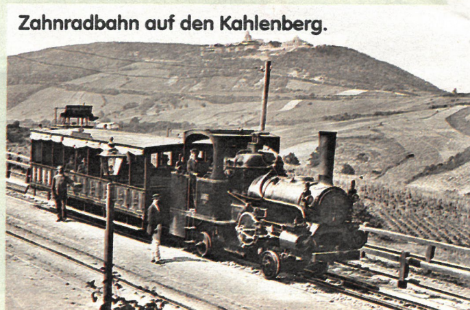
Zahnradbahn auf den Kahlenberg.

Doch auch die Zahnradbahn fristete über die nächsten Jahrzehnte ein kümmerliches Dasein. Die Wiener benutzten die Bahn, nach anfänglicher Begeisterung für die Naturschönheiten ihrer Hausberge, immer weniger.