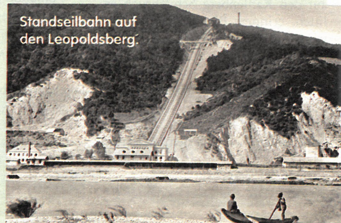
Standseilbahn auf den Leopoldsberg.

Nach der Eröffnung der Zahnradbahn auf den Kahlenberg sank das Fahrgastaufkommen der Seilbahn rapide. Kurze Zeit später kaufte das Konkurrenzunternehmen sie auf und legte die Seilbahn im Jahr 1876 still.