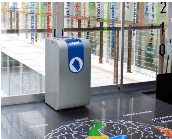
Abbildung 3-Symbol Fotos Abfallbehälter

Diese Art von Lösung wäre zu favorisieren, da praktikabel, gut integrierbar, sicher und formschön.