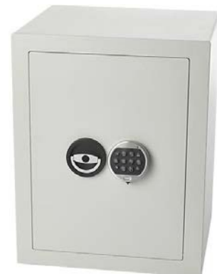
Abbildung 1 - Symbol Foto für Safe

Safes mit Schlüssel sind aus sicherheitstechnischen Überlegungen zu bevorzugen