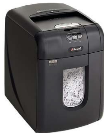
Abbildung 4-Symbol Foto Shredder

Anmerkung: Bitte beachten Sie, dass Shreddern eine suboptimale Lösung ist, weil einerseits die Reparatur- bzw. Wartungskosten zu berücksichtigen sind und andererseits das Müllaufkommen drastisch erhöht wird.