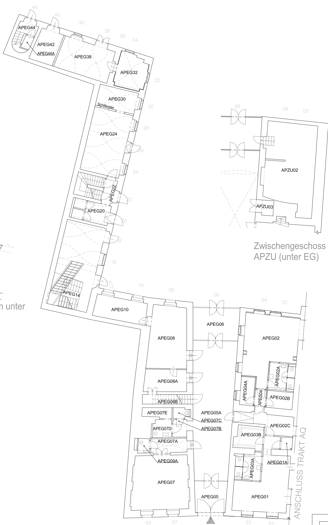
Zwischengeschoß APZU (unter EG)