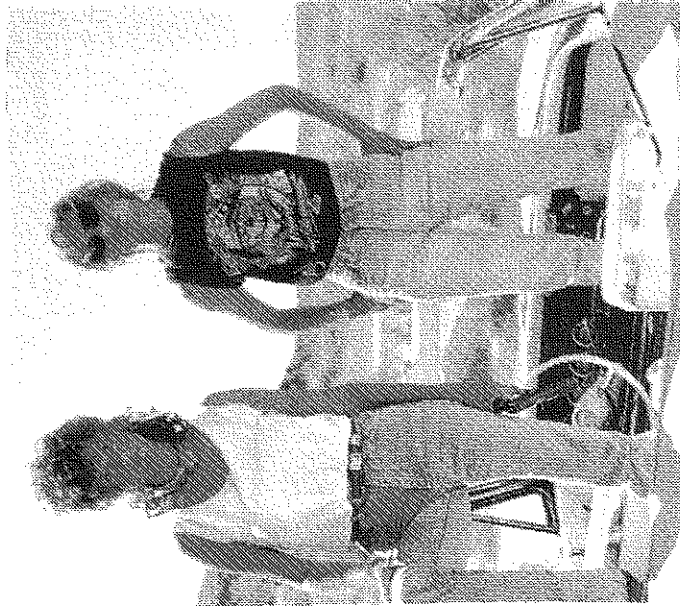
Geena Davis und Susan Sarandon in "Thelma & Louise"

Der erste Mann erkennt nicht, daß sie ein menschliches Wesen ist. Alle Männer, die sie hat, erkennen nicht, daß sie ein menschliches Wesen ist. (Kathy Acker/ Große Erwartungen)