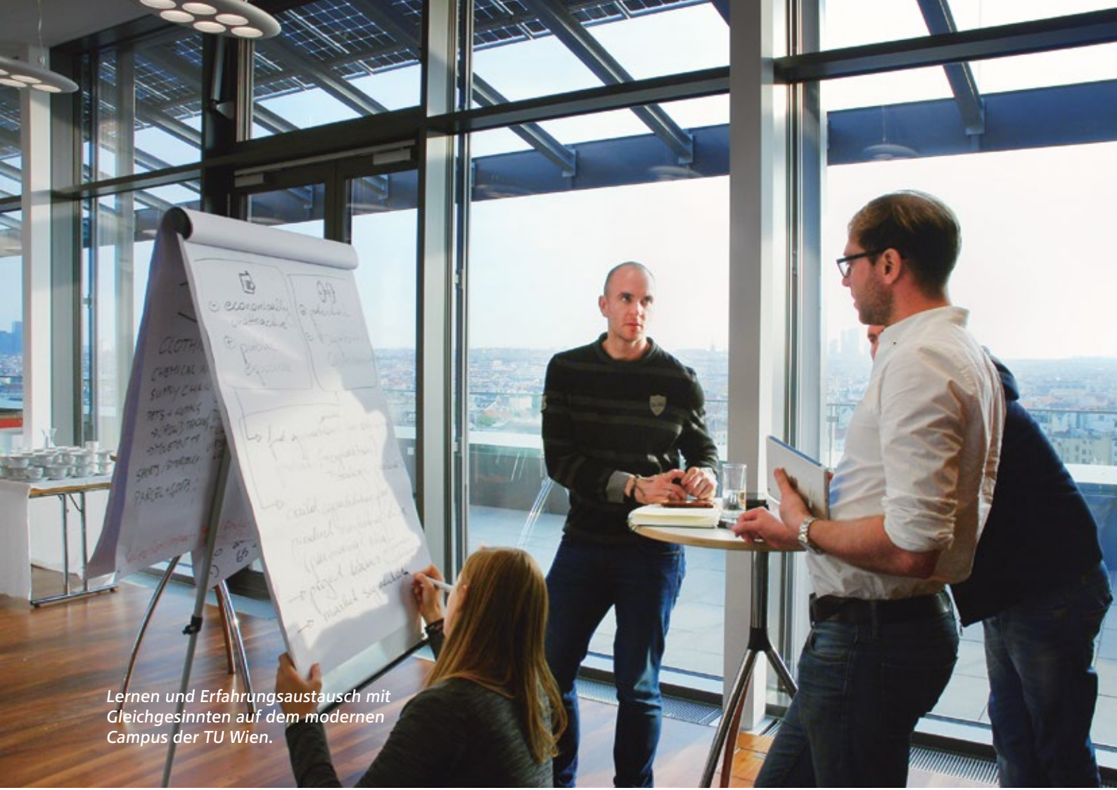
Lernen und Erfahrungsaustausch mit Gleichgesinnten auf dem modernen Campus der TU Wien.