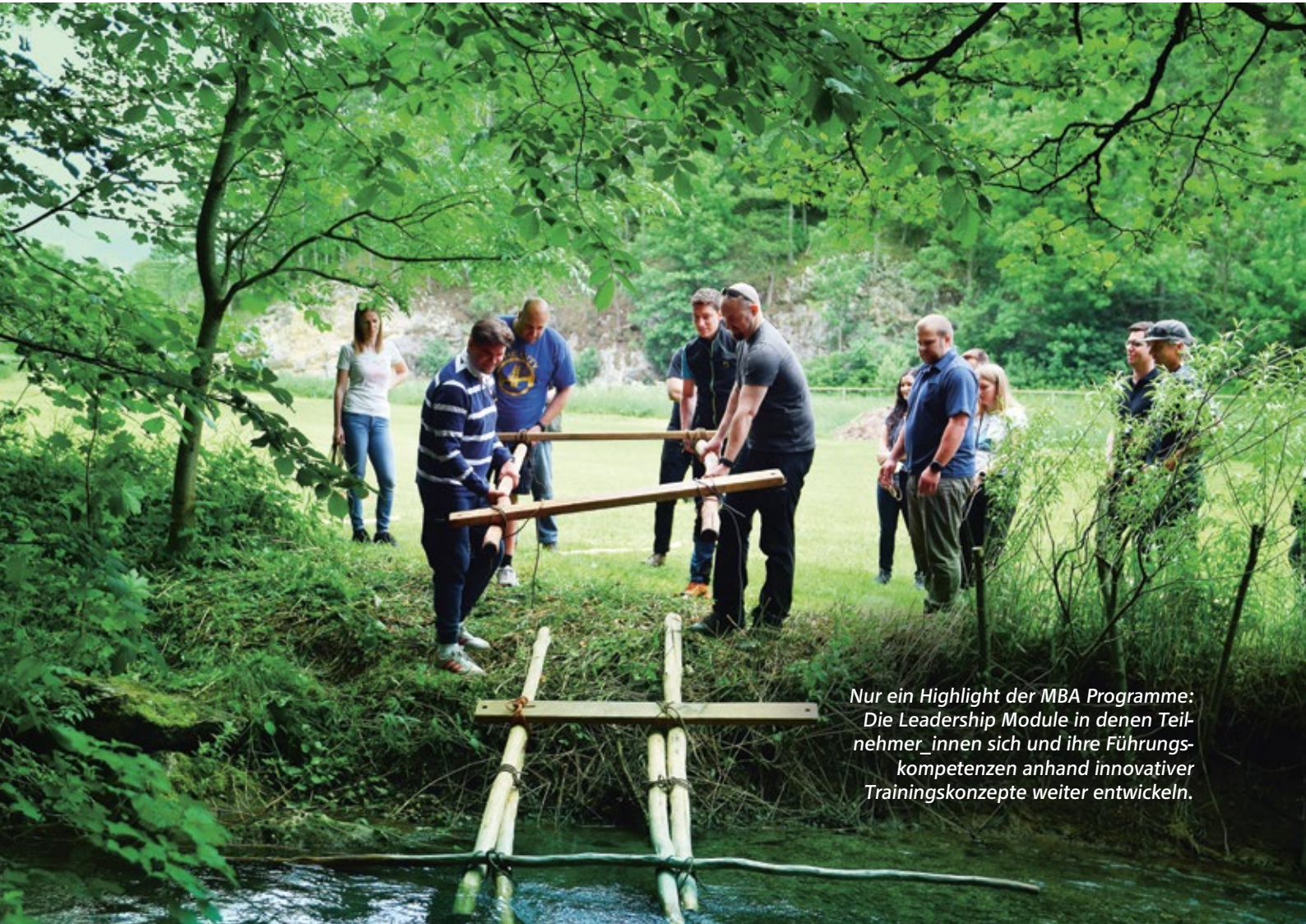
Nur ein Highlight der MBA Programme: Die Leadership Module in denen Teil- nehmer_innen sich und ihre Führungs- kompetenzen anhand innovativer Trainingskonzepte weiter entwickeln.