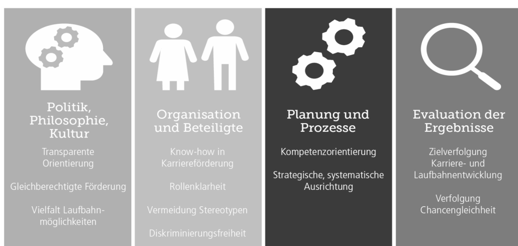
Abbildung 2: Themenfelder des Screenings. 5

Organisationen, die sich ein umfassendes, analysegestütztes Bild über ihre generelle und auf Frauen 45+ fokussierte Ausrichtung ihrer Personalentwicklung und Karriereförderung verschaffen möchten, können das mithilfe des in Zusammenarbeit mit verschiedenen Praxispartnern entwickelten Screenings tun. Die Besonderheit des Screenings liegt darin, dass Unternehmen Erfolgsfaktoren sowie Problembereiche der operativen Umsetzung erkennen können, um diese in der Folge gezielt anzugehen und die Ausrichtung ihrer Personalentwicklung und Karriereförderung nachhaltig auszurichten. Das entwickelte Screening deckt unterschiedliche Themenbereiche ab und unterscheidet vier Elemente, mit denen eine Status-Quo-Validierung vorgenommen werden kann: